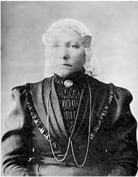
Dieuwke Bakker – Althuisius (1855 – 1935)

Verschillende familieleden treden op als getuige bij het huwelijk, zoals Popke Sjoerds Bakker, oud 75 jaren, veldwachter te Langweer, grootvader van de bruidegom, en de ooms, die ook in Langweer woonden te weten Lammert Popkes Bakker, logementhouder en koopman, alsmede Hendrik Popkes Bakker, oud 30 jaar, wagenmaker van beroep.