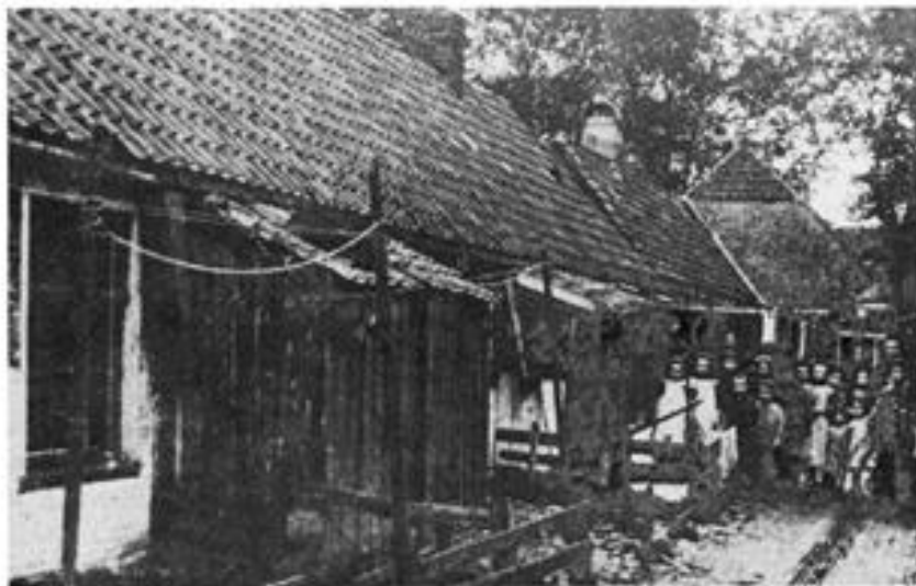
't Achteromty in St. Anne, erbaaiersonderkommens in de leste hult fan de 19e eeuw.

't Burgerlik aarmbestuur besteedde meer dan f 30.000,00 in 't jaar an de aarmesorg, maar ok dermet kon men de erbaaiers niet 'n mînsweerdig bestaan geve.