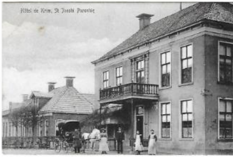
De Krim in St.-Jabik

'n Week of wat later waar Domela alweer op 't Bildt. De offens fan de 12de april sprak hij de overdâgs weer 'n saal fol mînsen toe in St.-Anne en de avens konnen de Stjabuurtsters in herberg De Krim him praten hore over Algemeen Kies- en Stimrecht. 't Tal anhangers fan syn ideeën groeide flug.