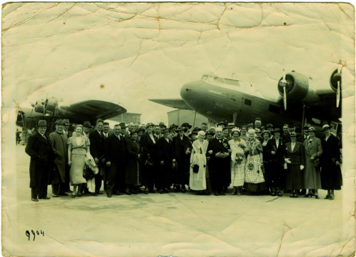
Djoke en Anny yn Frysk kostúm yn selskip fan setierdappelhannelers en -eksporteurs