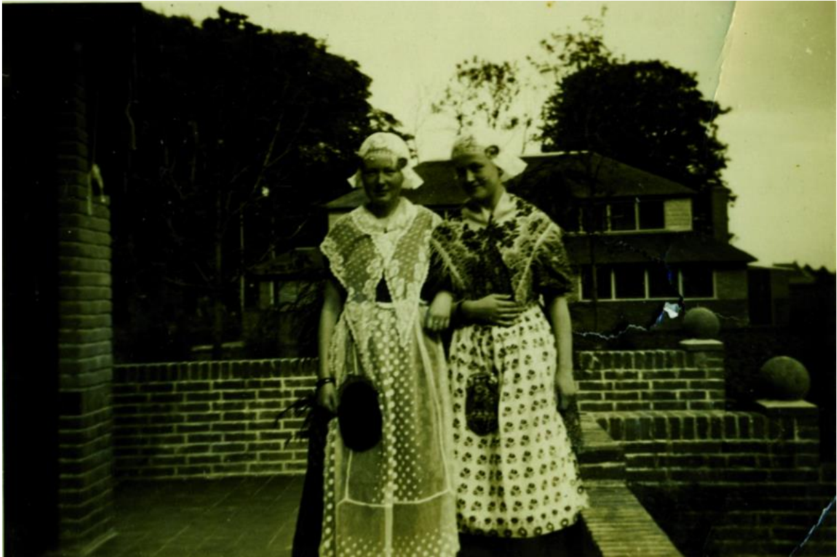
Op it terras fan 'e Twa Damkes te Bitgummole